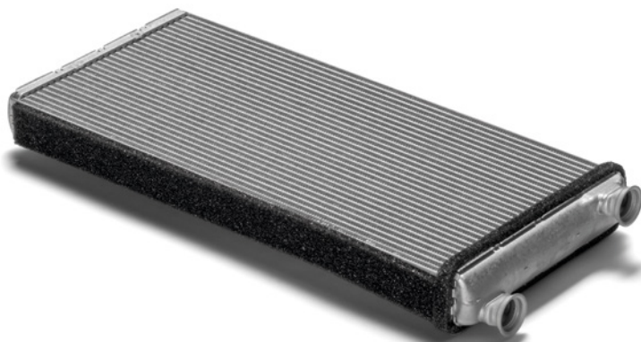
MAN Original Heizkörper ab: CHF 189.-