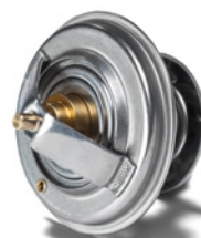
MAN Original Thermostate ab: CHF 25.-