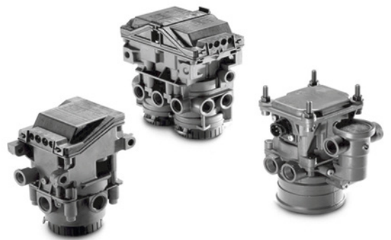
MAN Original Bremsventile ab: CHF 435.-