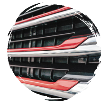
MAN Original Designstreifen Kühlergrill (Set) ab: CHF 229.-