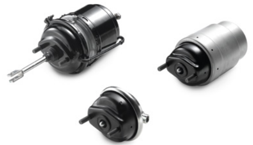
MAN Original Bremszylinder ab: CHF 195.-