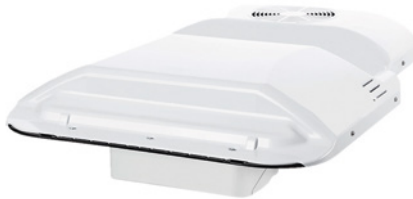
MAN Original Dachklimaanlage Cooltronic ab: CHF 2245.-