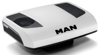
MAN Original Dachklimaanlagen Als RTX2000 und mit noch höherer Kühlleistung als RTX1000 verfügbar. ab: CHF 2470.-

Mit den MAN Original Standklimaanlagen können Sie Ihre Ruhezeiten erholsam im Fahrerhaus verbringen, ohne stundenlang den Motor laufen zu lassen und grosse Mengen an Kraftstoff zu verbrauchen. Gut ausgeruht fahren Sie sicherer. Durch ihre hocheffiziente Technik kühlen die Anlagen schnell und zuverlässig bis zu 12 Stunden, und das bei niedrigen Betriebskosten.