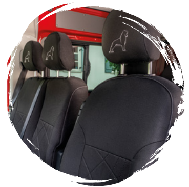
MAN Original Sitzschonbezüge TGE Passgenaue Bezüge für alle verfügbaren TGE-Sitzvarianten. ab: CHF 110.-