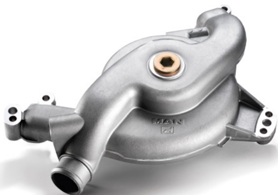
MAN Original Kühlwasserpumpen ab: CHF 295.-