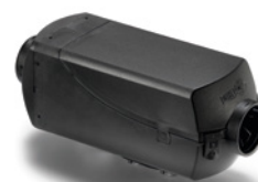
MAN Original Heizgerät ab: CHF 2260.-