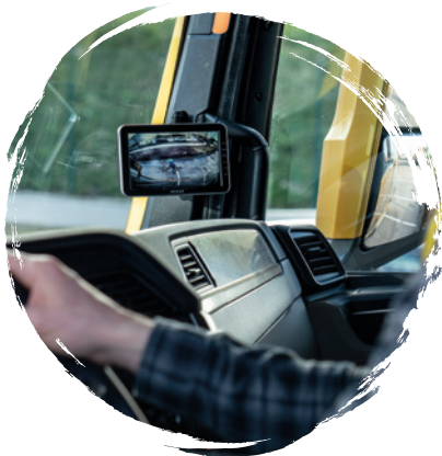
MAN Original Seitenkamerasystem (Nachrüstset) ab: CHF 1500.-