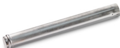
MAN Original Flüssigkeitsbehälter ab: CHF 130.-