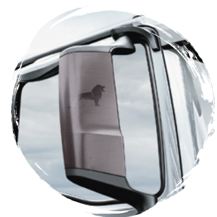
MAN Original Abdeckung Spiegelkappe ab: CHF 149.-