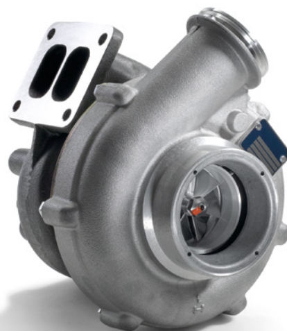
MAN Original Abgasturbolader ecoline ab: CHF 1189.-