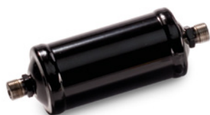
MAN Original Trockenpatronen ab: CHF 125.-