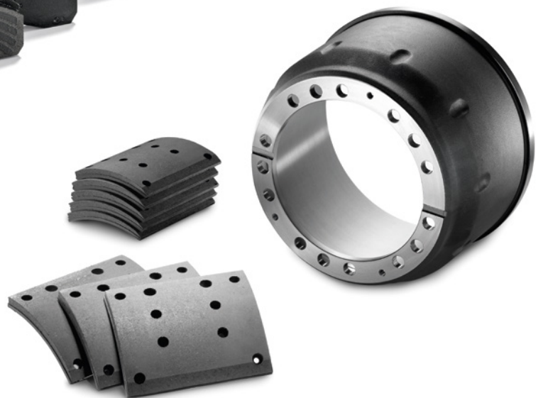
MAN Original Trommelbremsbeläge ab: CHF 165.-