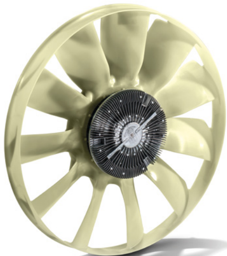
MAN Original Motorlüfter ab: CHF 1309.-