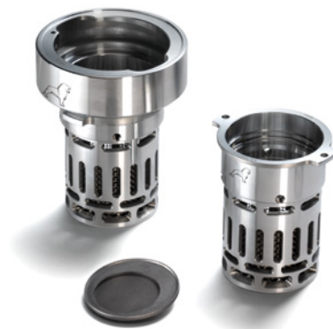
MAN Original Kraftstofftank-Schutzvorrichtungen ab: CHF 65.-