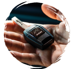
MAN Original Aufkleber Schlüssel ab: CHF 8.50