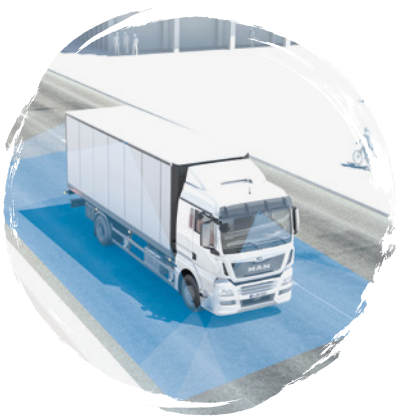
MAN Original BirdView 360°-Kamerasysteme ab: CHF 2810.-