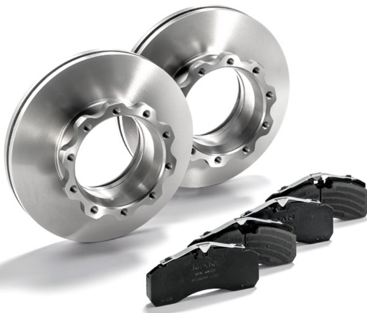
MAN Original Bremsscheiben ab: CHF 102.-