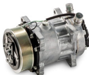
MAN Original Kältekompressoren ab: CHF 910.-