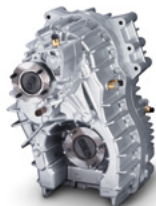
Sistema de tração