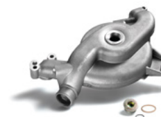
Sistema de arrefecimento